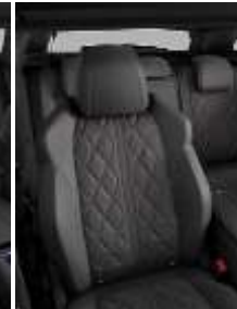
Темная натуральная кожа 'Narra' (перфорированная)