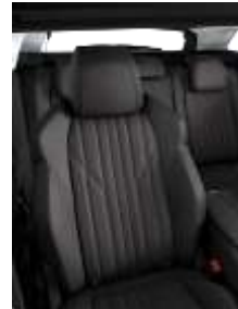
Темная натуральная кожа 'Claudia'