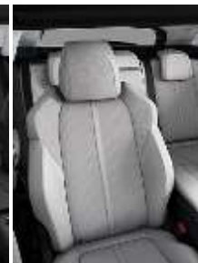
Светлая искусственная кожа + ткань 'Evron'