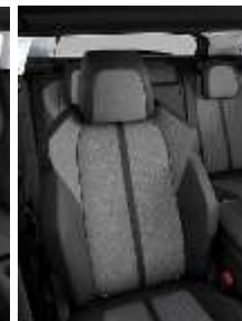
Темная искусственная кожа + ткань 'Piedimonte'