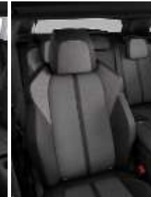
Темная искусственная кожа + ткань 'Imila'