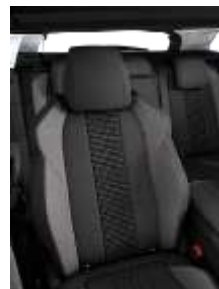
Темная ткань 'Meco'